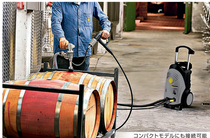
コンパクトモデルにも接続可能