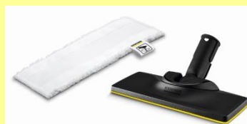
「イージーフィックス フロアノズルセット」(オープン価格)

オプションアクセサリとして単品でも購入いただけます。これまでのケルヒャー家庭用スチームクリーナー全機種に対応します。