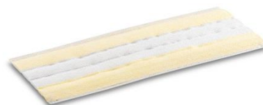
「イージーフィックス用使い捨てクロス」

同時発売するカーペット清掃専用アクセサリ「イージーフィックス用カーペットグライダー」は、カーペットにスチームクリーナーをかける際にクロスがヨレたり引っ掛かったりすることを防ぎます。スムーズな清掃が可能となり、なかなか洗えないカーペットをリフレッシュさせることができます。