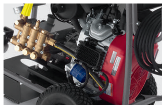
信頼のホンダ製エンジン

※1) 作業をしていない時にエンジンの回転を抑え、エンジンへの負荷を軽減することでトラブルを防ぎます。