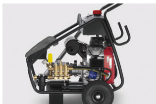
本体ユニットを守る頑丈なフレーム