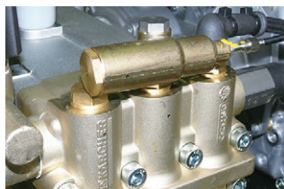
エンジン速度調整機能