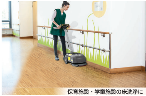
保育施設・学童施設の床洗浄に