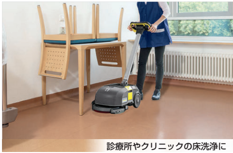
診療所やクリニックの床洗浄に