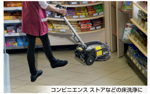
コンビニエンスストアなどの床洗浄に