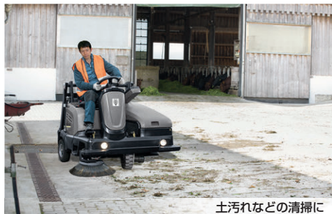
土汚れなどの清掃に