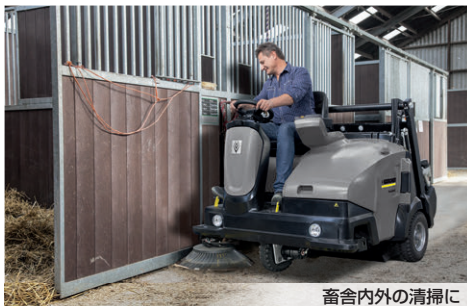
畜舎内外の清掃に