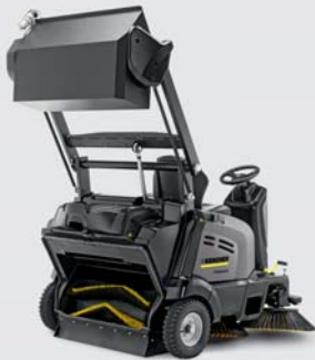
リフトアップできるコンテナで、ゴミの廃棄を効率良く