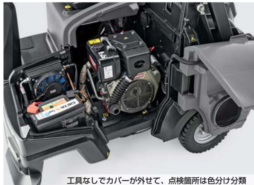
工具なしでカバーが外せて、点検箇所は色分け分類