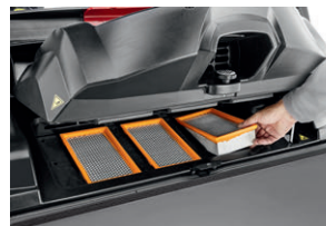
小型化で交換やメンテナンス時間を削減