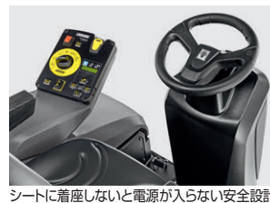
シートに着座しないと電源が入らない安全設計