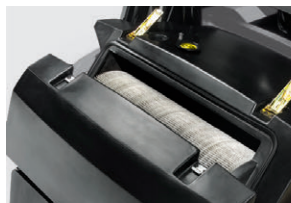
従来機種の筒型フィルター

フィルターは「自動チリ落とし機能」を採用。メンテナンス時間を短縮し、バキューム力を落としません。また、フィルターの小型化により、省スペース化とフィルターコストを抑えられます。