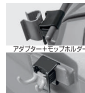
アダプター+モップホルダー