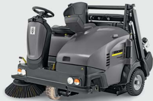
国内販売モデル：ノンバンクタイヤ、ウィンカー、作業灯装着