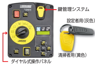
鍵管理システム 設定者用(灰色) 清掃者用(黄色) ダイヤル式操作パネル

鍵管理システムにより、清掃者によって生じる過度な設定からの事故を防ぎ、どなたが清掃しても均一な仕上がりが得られます。また、操作パネルはイラストにダイヤルを合わせるだけの簡単操作です。