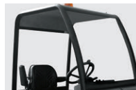
保護ルーフ(屋根のみ)