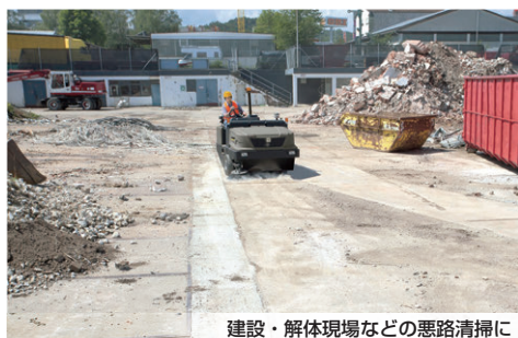
建設・解体現場などの悪路清掃に