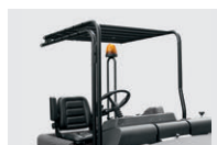
簡易保護ルーフ(屋根のみ)