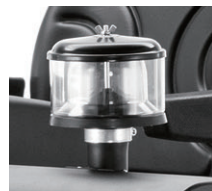
エンジン用プレフィルター