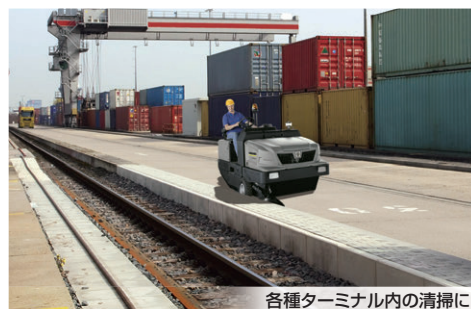
各種ターミナル内の清掃に