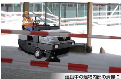
建設中の建物内部の清掃に