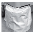
サイドブラシカバー