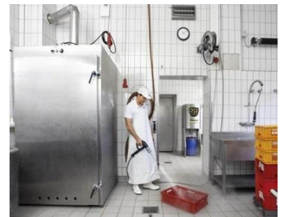
「セントラル洗浄システム」イメージ

ラインに高圧洗浄機本体を置くことなく、ピンポイントでトリガーガン(洗浄パーツ)が使用可能。