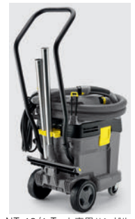
NT 40/1 Tact 専用ハンドル 注文番号: 2.643-868.0

標準装備 (帯電防止用のサクシオンホースとベンディングパイプへの交換で、帯電防止仕様に変更可能です)