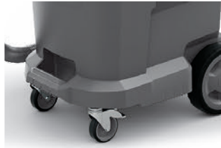
バンパー付きのボディで強度向上

ボディは強化プラスチック製で軽くて丈夫です。作業や移動がスムーズに行え、サビやへこみの心配もありません。