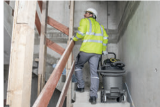
大型タイヤで階段移動もサポート