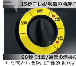
15秒に1回/粉塵の清掃に