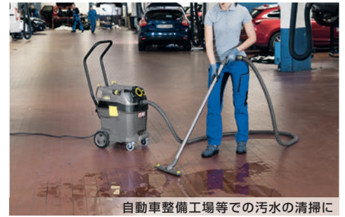
自動車整備工場等での汚水の清掃に