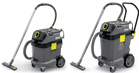
NT 40/1 Tact