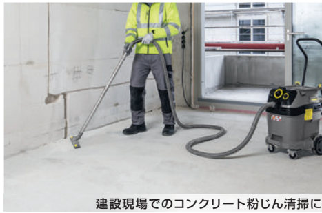
建設現場でのコンクリート粉じん清掃に