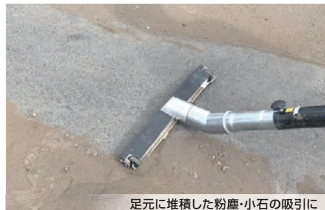
足元に堆積した粉塵・小石の吸引に