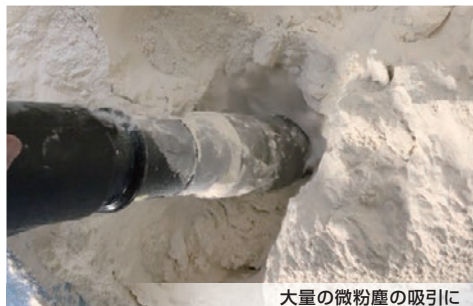
大量の微粉塵の吸引に