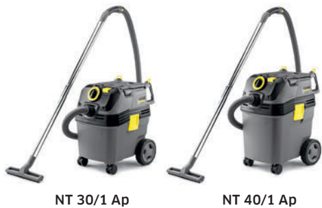
NT 30/1 Ap