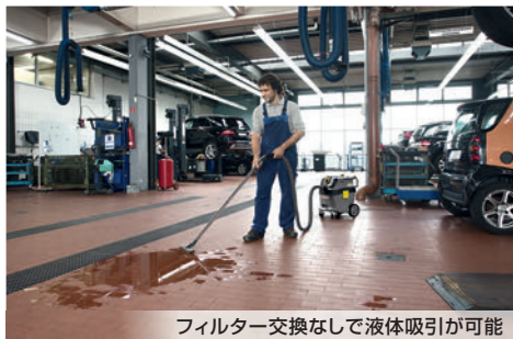
フィルター交換なしで液体吸引が可能