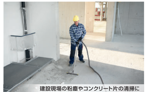
建設現場の粉塵やコンクリート片の清掃に