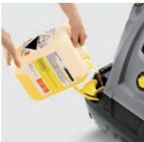
ガイド付の大型補給口