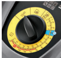
操作しやすい大型ダイヤル

作業内容が一目で分かるイラスト入りダイヤルで、どなたでも操作ができます。洗浄剤と燃料の供給口が大きく液ダレを防ぎます。