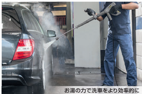
お湯の力で洗車をより効率的に