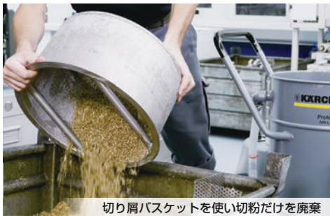
切り屑バスケットを使い切粉だけを廃棄