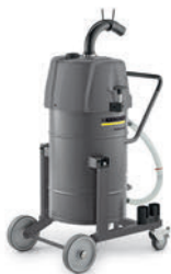
IVR-L 65/12-1 Tc