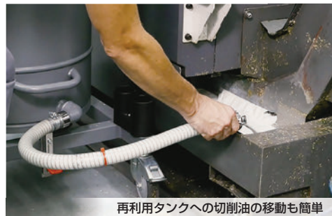
再利用タンクへの切削油の移動も簡単