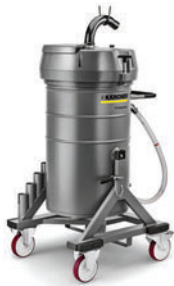
IVR-L 120/24-2 Tc