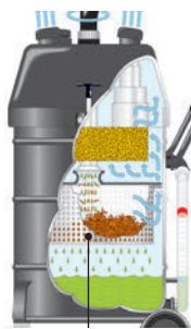
切り屑バスケット