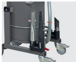
アクセサリホルダー