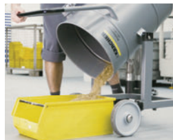
簡単 チルト式タンク