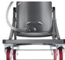
廃棄の労力を軽減