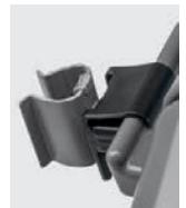
アダプター + ダブルフック アダプター + モップホルダー