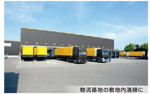
物流基地の敷地内清掃に