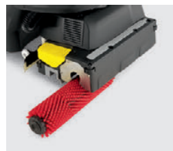
ブラシやスクイジーは工具無しで着脱可能