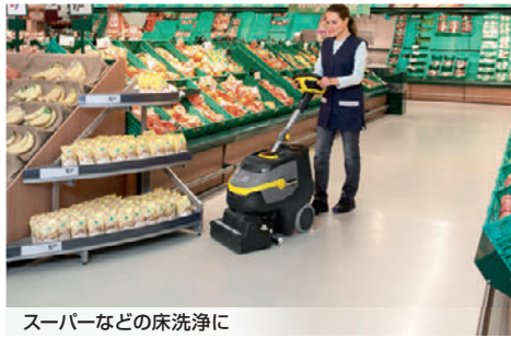
スーパーなどの床洗浄に