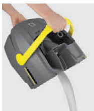
手を汚さず汚水を廃棄