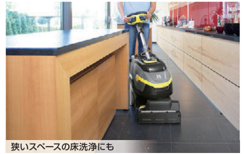
狭いスペースの床洗浄にも